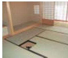
炉を備えた「下京の間」

今春、下京区の郁文・成徳・尚徳・皆山・梅逕中学校が統合され、元尚徳中学校の敷地に下京中学校が開校しました。区内19の元学区の子どもたちが通う新中学校を、ご紹介します。