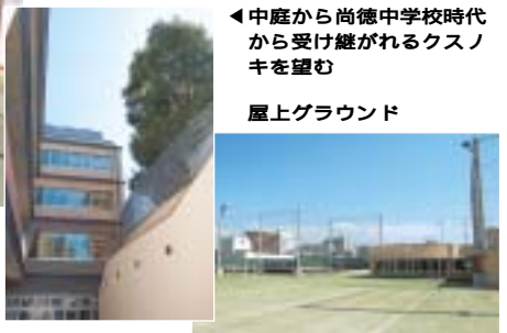
◀中庭から尚徳中学校時代から受け継がれるクスノキを望む